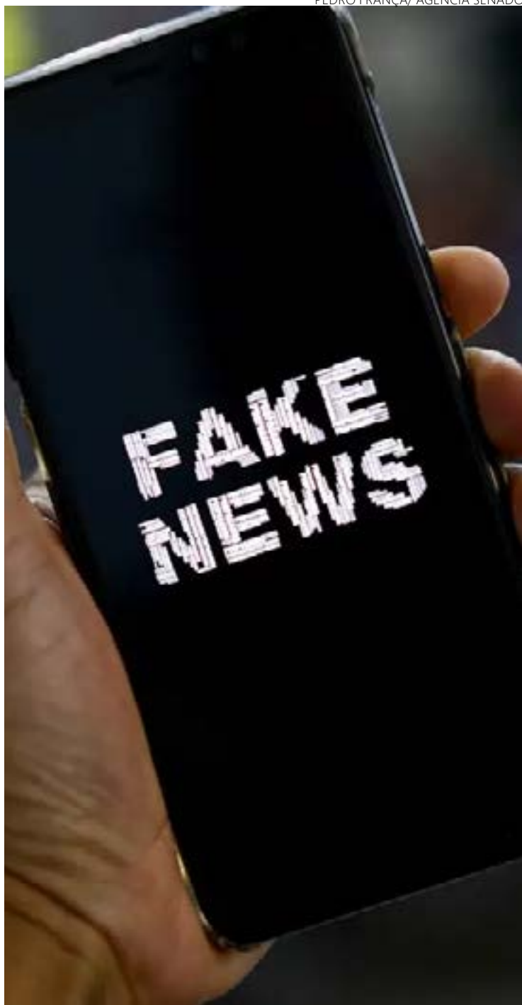
PL quer incluir fake news no Código Penal

Desde que as tecnologias alteraram as relações humanas, os computadores, smartphones e tablets passaram a fazer parte