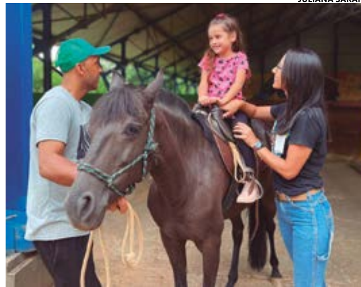
Atualmente cerca de 160 pacientes estão em tratamento dentro do serviço prestados pelo hospital, com os mais diversos diagnósticos

O ideal é evitar o complemento com alimentos ricos em açúcar e de baixa qualidade nutricional, que tornam o açaí mais calórico e menos saudável. Na hora das compras, vale a mesma lógica: evite versões com aromatizantes artificiais, xaropes ou açúcar. O mais saudável é o açaí puro. Se você fizer questão de comprar açaí adoçado, é mais indicado procurar aqueles que têm adoçantes naturais, como stevia e xilitol.