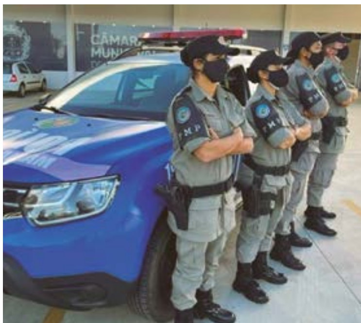
Quando o cálculo é ampliado para acompanhamento remoto, o crescimento se torna ainda mais impressionante, alcançando os 418%

Informação é do 3º Comando Regional da Polícia Militar (CRPM) e evidencia a relevância da Patrulha Maria da Penha em Anápolis