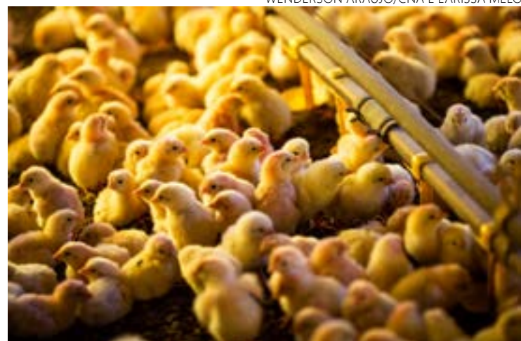
WENDERSON ARAUJO/CNA E LARISSA MELO

Ele acrescenta que como estamos em situação de alerta, é preciso ter o máximo de controle sobre esses estabelecimentos. “Quem não é registrado, deve se cadastrar dentro das normas estabelecidas na instrução normativa, até para seguir as medidas sanitárias contidas nele. Isso é imprescindível para que não tenhamos