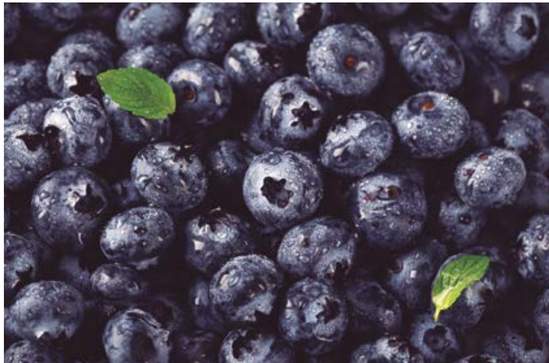
Alimento tem alta capacidade antioxidante, ou seja, tem propriedades que conseguem combater radicais livres

“O Regimento de Cavalaria da PMGO é fundamental para o bom funcionamento do nosso serviço. Eles fornecem a hotelaria, grande parte da alimentação dos animais e a assistência veterinária, além de possuírem anos de experiência no trato com os cavalos”, explica.