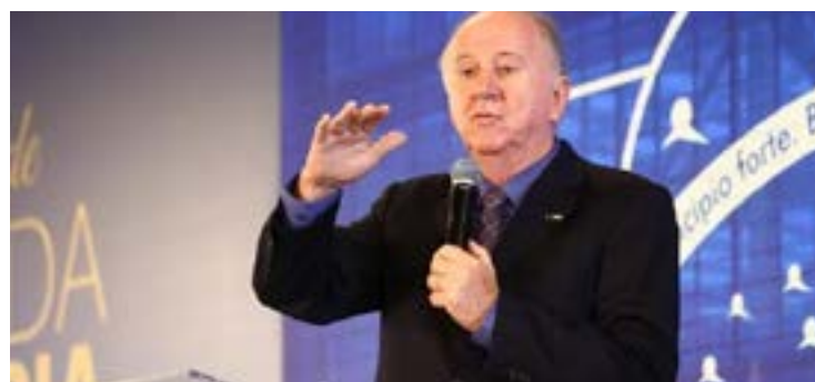
Paulo Ziulkoski: prefeituras sem recursos