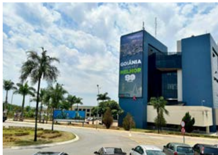
Sede da prefeitura de Goiânia: empréstimo para obras de infraestrutura