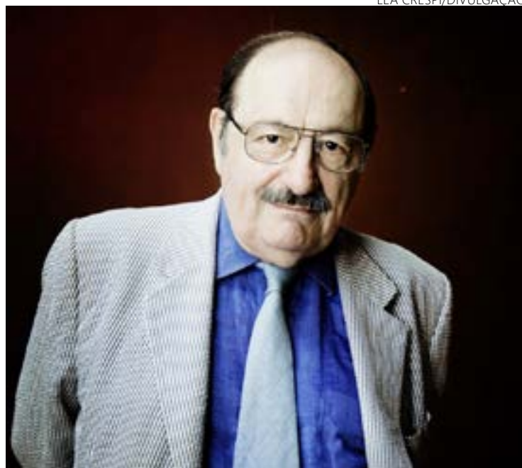
Umberto Eco, filósofo: redes deram voz a imbecis

Conteúdo forjado. Fake news também pode ser criada com conteúdo inventado. Fotos ou vídeos manipulados, por exemplo, podem ser usados para criar uma