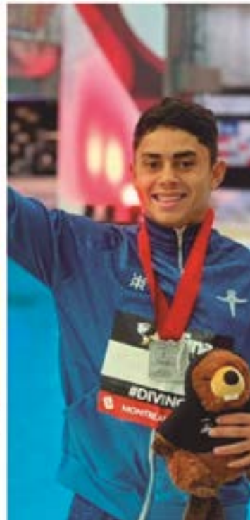
Modalidades olímpicas tiveram brilho nos Pan-Americanos. Cidade também foi sede de eventos importantes

grande objetivo do ano não foi alcançado: o acesso para a primeira divisão do Campeonato Goiano. Apenas duas equipes retornaram para a competição, o Goiatuba, com mais folga e a Jataiense, pelos critérios de desempate.