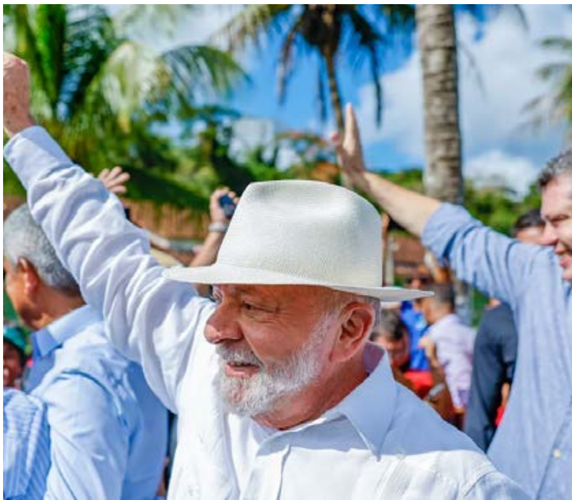
Lula da Silva: percorrer o país este ano em busca de votos ao PT e aliados

Em ano de eleição municipal, os aliados de Lula apostam também em discursos contra a