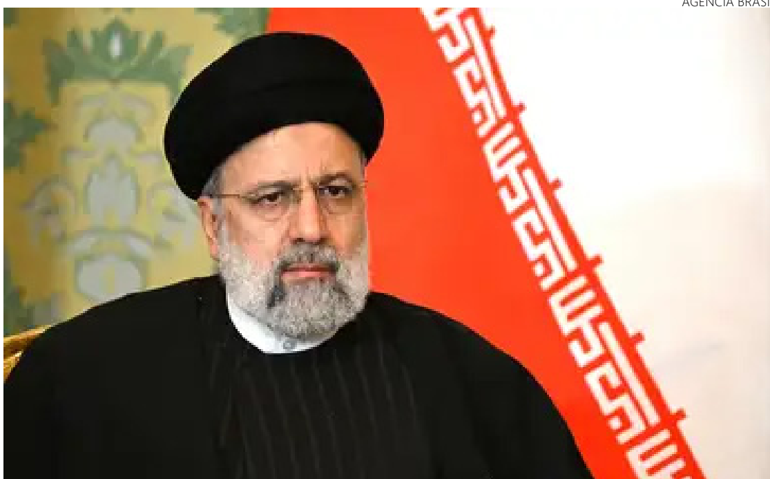
Presidente do Irã, Ebrahim Raisi, promete vingança por atentado

Ainda não há autoria reivindicada por nenhum dos diversos grupos contrários ao regime teocrático de Teerã em