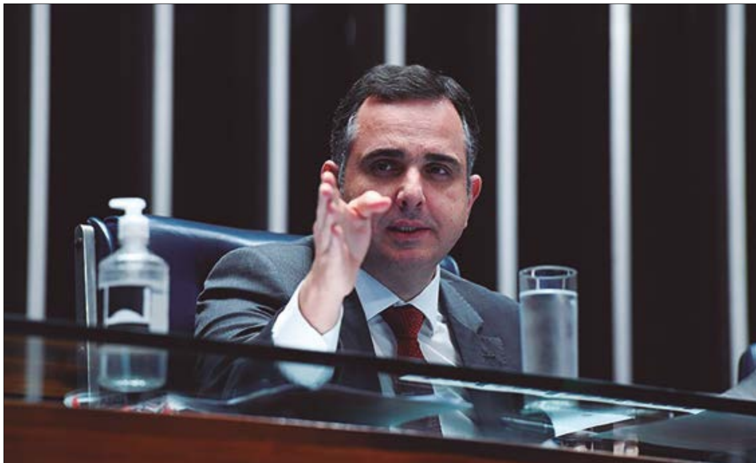
Presidente do Senado, Rodrigo Pacheco, propôs que uso dos R$ 4,9 bilhões obedeça a algumas regras; especialistas opinam sobre a medida

O advogado ressalta que na hora da eleição, todos são candidatos, não há diferença em relação ao que preconiza a legislação, mas quando é feita a distribuição do Fundo Eleitoral,