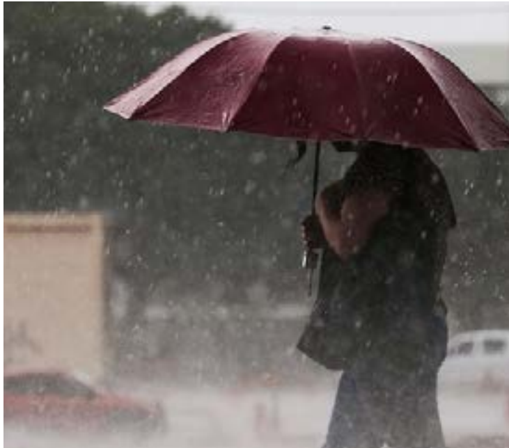
Segundo o Inmet, o aviso segue até esta quinta-feira (4), com possibilidade de se estender pelos próximos dias

Estão previstas chuvas entre 30 e 60 milímetros (mm/h) ou